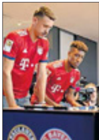
Sandro Wagner und Kingsley Coman (rechts) nahmen sich Zeit für ihre Südtiroler Fans.