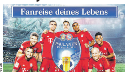
Haushalt der Bayern-Stars bei der Arbeit zusammen. Zwei Fans können die große USA-Reise des Double-Siegers mit dem neuen Coach Carlo Ancelotti begleiten.

München - Vor den Erfolgen haben die Götter den Schwitz gesetzt. Das gilt auch für die Double-Sieger des FC Bayern, bei denen ab dem 11. Juli Carlo Ancelotti das Zepher schwingen wird. Und die Vorbereitung hat es in sich. Es geht über den großen Teich in die Staaten. Und das tollste daran, Sie können dabei sein. Vom 25. Juli bis zum 4. August sind die Münchner auf großer USA-Reise: spielen dort gegen US-Mannschaften (27. Juli in Chicago) gegen Inter (30. Juli in Charlotte, N.C.) und zum Abschluss am 3. August in New York gegen Ancelotti Ex-Klub Real Madrid.