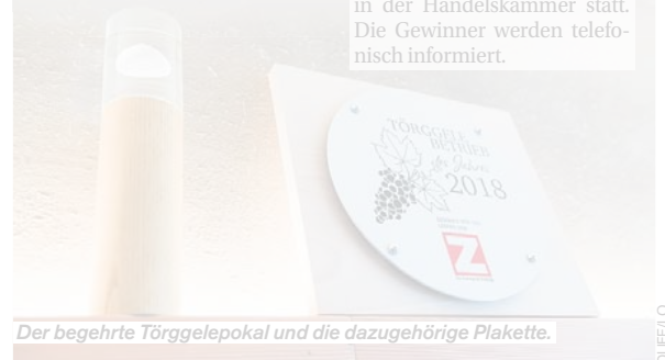
Der begehrte Törggelepokal und die dazugehörige Plakette.