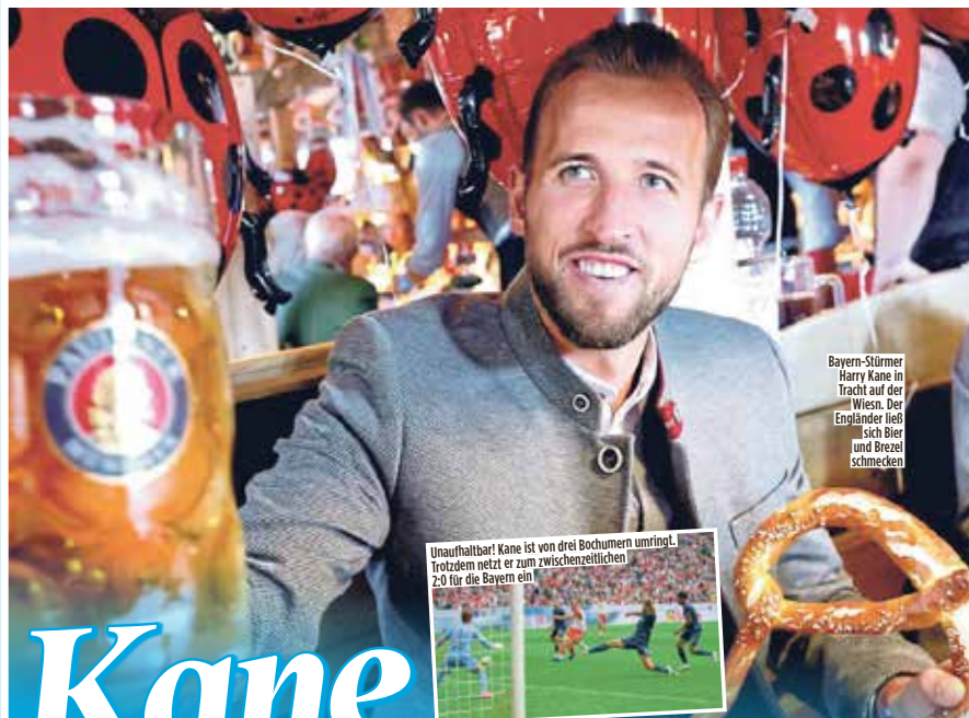
Bayern-Stürmer Harry Kane in Tracht auf der Wiesn. Der Engländer liebt sich Bier und Brezel schmecken