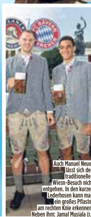
Auch Manuel Neuer lässt sich den traditionellen Wiesn-Besuch nicht entgehen. In den kurzen Lederhosen kann man ein großes Pfister am rechten Knie erkennen. Neben ihm: Jamal Musiala (r.)