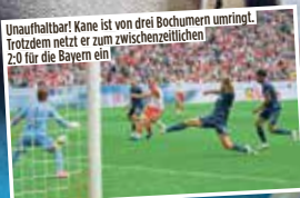
Unaufhaltbar! Kane ist von drei Bochumern umringelt. Trotzdem netzt er zum zwischenzeitlichen 2:0 für die Bayern ein